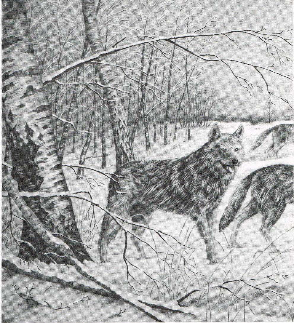
(tekening: Alfons Kruse)