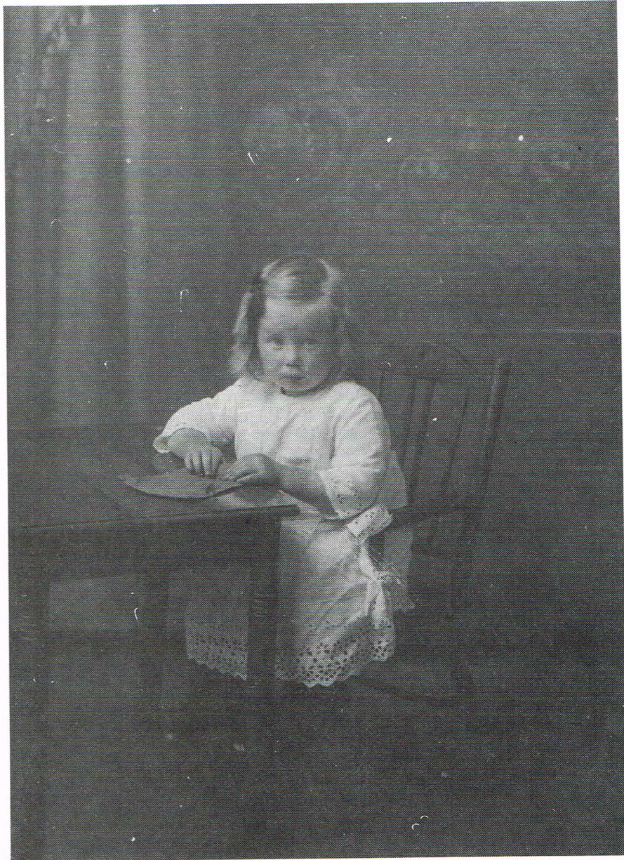
Doe Margje nog gien riempies schreef...