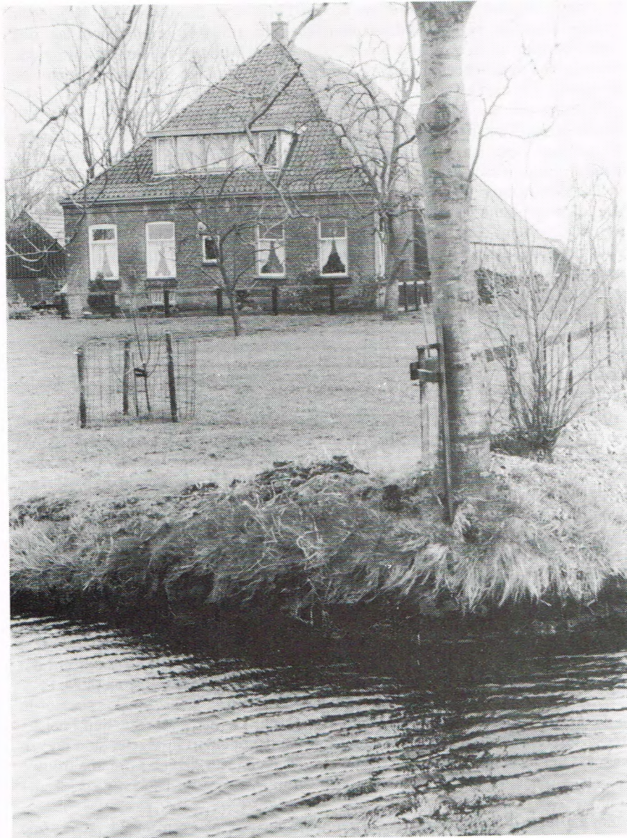
De plaetse in Ni'jhooltwoolde waor oonze volk van 1631 of boerkt hebben