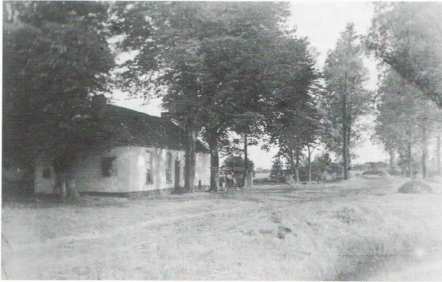
Pleisterplak „De Ooievaar”.