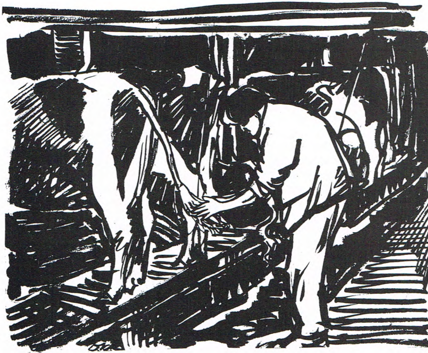
Stattewaschen. Een vertrouwd beeld uut et Stellingwarver boereleven (tekening: D.K. Koopmans)