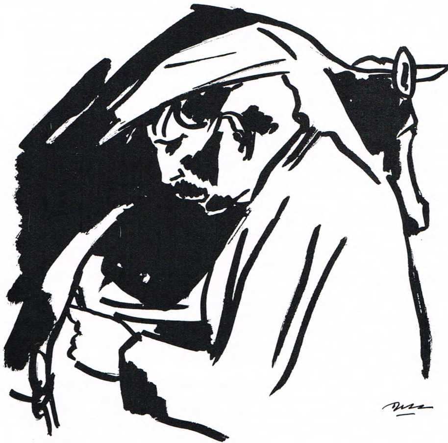
Melkerstied. Een prentien vol herinnerings an vroeger. (tekening D.K. Koopmans)