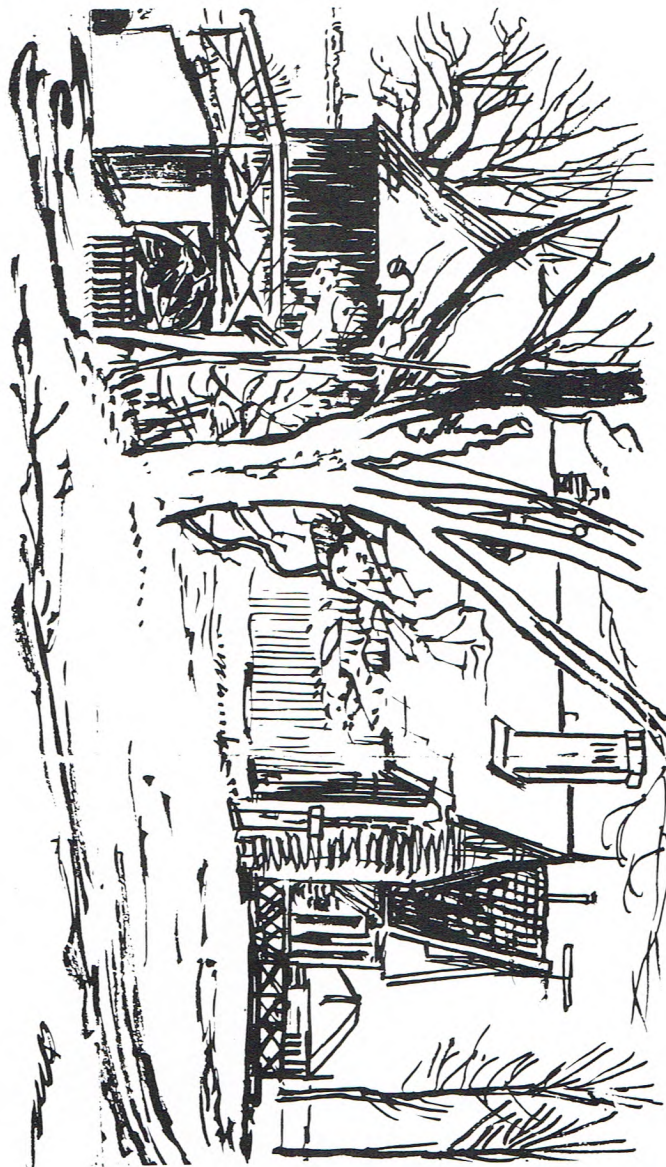
Gemael in de poolder bi'j Hooltwoolde, tekend deur Dirk Kerst Koopmans