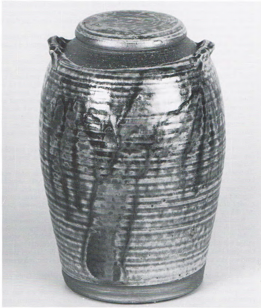
Pot mit lit; stiengoed mit engobe en asglazuur; 20 x 30 cm.