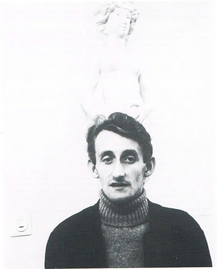
Jeugdfoto van de schrijver Johan Veenstra, publiceerd in de eerste oflevering van Uut de pultrum van de Liwwadder Kraante op 29 jannewaori 1972.