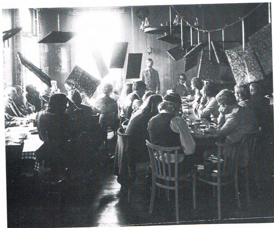
Bi'j gelegenhied van et eerste lustrum verscheen de schrieversalmenak Onder eigen volk . Hier et gezelschap schrievers bi'j de prissentaoisie in kefé "De Veehaandel" in Spange in 1976.