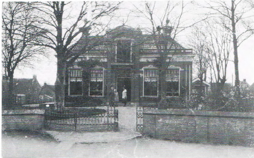
De pasteri'je van Jorwerd