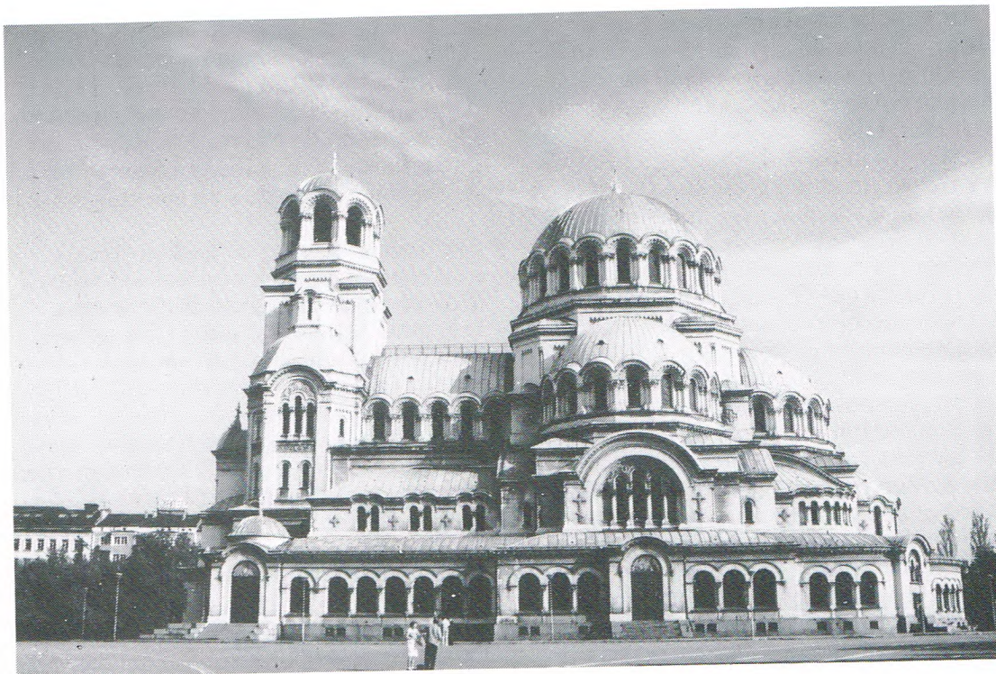
De Alexander Nevski Kathedraol in Sofia.

wegdek, mit een bessem schone vegen. De klinkers liggen d'r hier allerbelabberdst bi'j. Ze hebben wel es docht over een metro, mar die was vusen te duur.