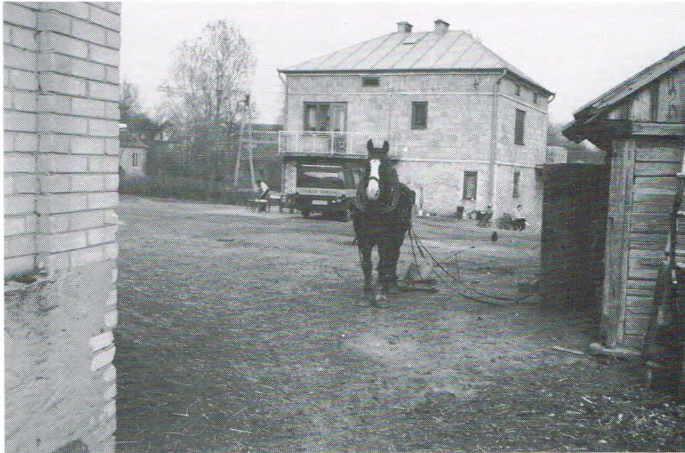
Et huus en et peerd van de familie Karawaki.