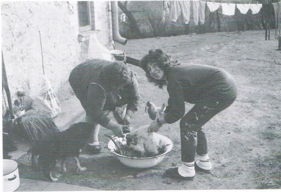
Dorota en heur mem bin op et hiem an 't slaachten.