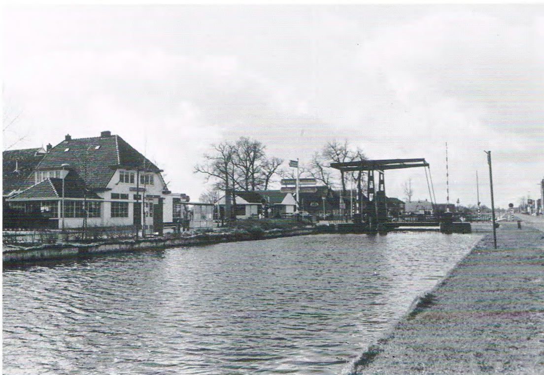
Kefé Hulst en de brogge in oonze daegen.

was, dat de groep verlet van menusie kreeg en Sicoud vreug via de radioverbienings anvulling van et schaorse materiaol, en dat kreeg hi'j op donderdag 12 april, in de morgenuren.