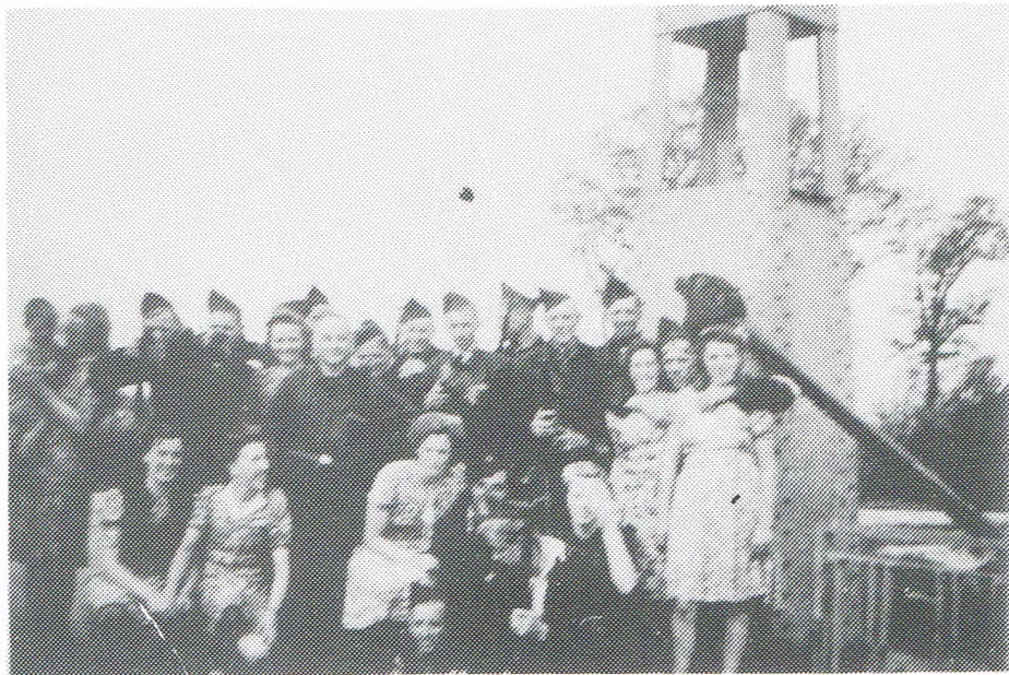
Fraanse parrechutisten, ondergroonse strieders en wat vrouwluden bi'j de brogge van Hulst in et Stokersverlaot in Appelsche.