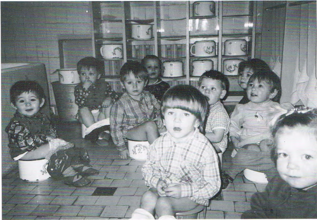
Allemaole op 'e pot!

kiend een pot en een schone haanddoek is. En nog een grote waor veur iederiene een klein beddegien staot.