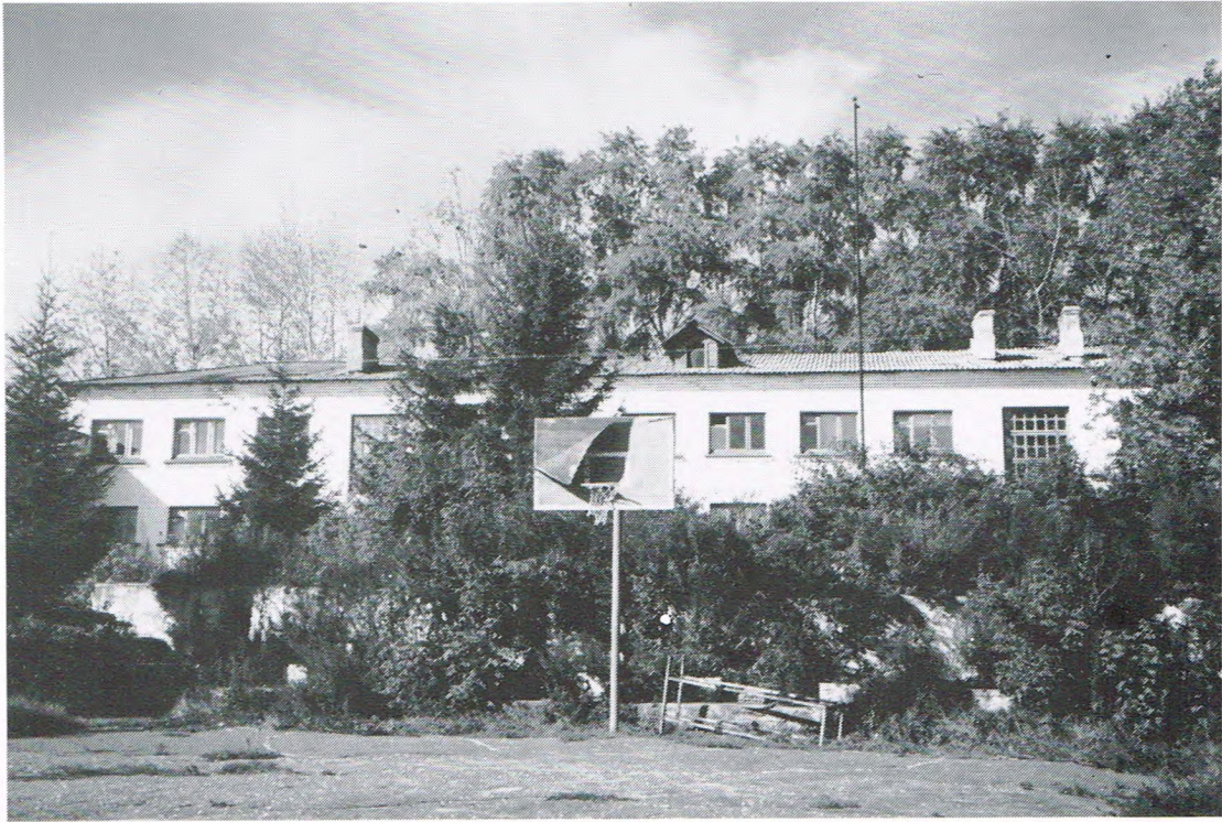
In disse oolde kezerne kriegen we oons eigen huus.