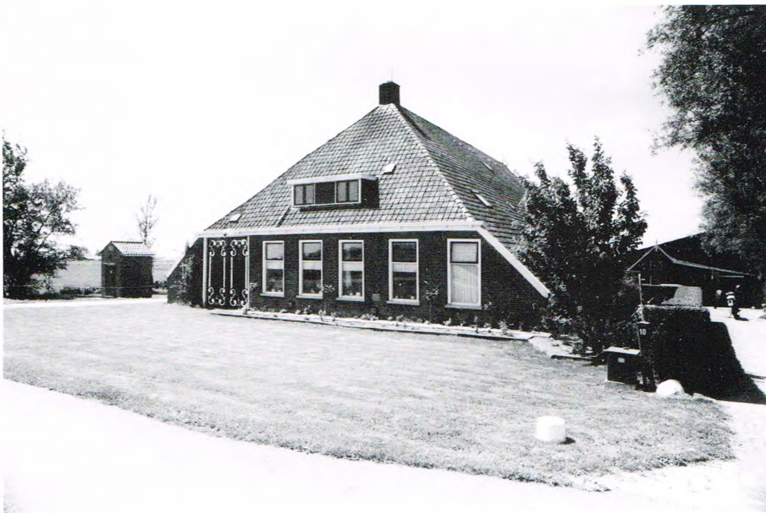
De boerderi'je van de Brouwers an de Lendiek.

"Hier het now vief-tien jaor lange een grote