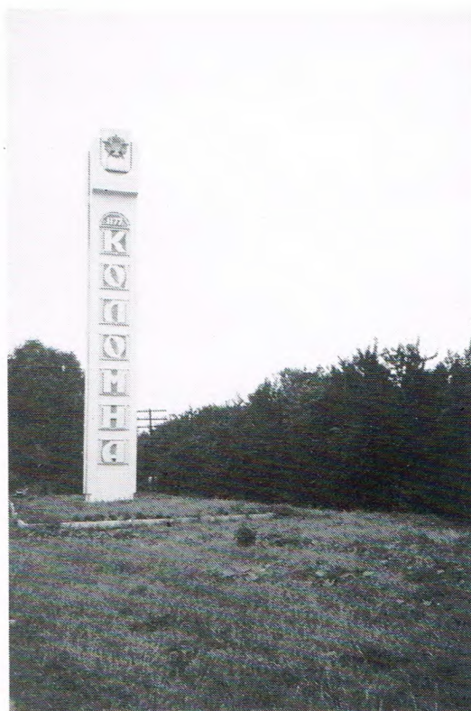
Plaknaembod van Kolomna.

zuken en daor zo gauw meugelik bi'j in trekken.