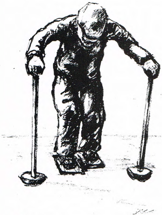
Ofb. 1 De turfmaeker (of trapper, DKK) mit de bodden onder en de polsstokken (of polsies, DKK).

zat de spieker wat hoger, omreden et vene veurdat de turfmaeker kwam al wat inzakte, deurdat et uudreugde. Et anbreken op himzels was slim zwaor wark, trouwens liek as alle ere veenarbeid. De turfmaeker mos mit de bodden onderbunnen et vene in mekere trappen, mit de veuraenden van die bodden goed naor beneden. As hi'j ien keer over et vene henne west was, gong hi'j d'r nog een keer overhenne trappen. Die haandeling wodde spoortrappen nuumd. Nao een dag of wat gebeurde dat nog es weer, mar dan hiette et oftrappen . An ark hadde de turfmaeker veerder twie polsstokkies . Bi'j et trappen kon hi'j daor mit de hanen op steunen. An de onderkaante van zoe'n polsstok zat een rond bottien , dan kon de stok niet in et vene wegzakken. An de boverkaante zat een krukke , daor de turfmaeker de polsstok mit vaastehul (zie ok hierveur ofb. 1).