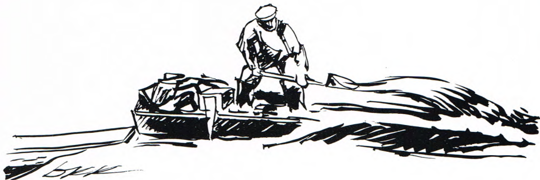
Ofb. 4 Uut de baggelbak (of mengbak, DKK) wodt et over de wal put.

Een span baggelmannen beston uut een spitter en een minger. De spitter mos een scheppe mit een lange staele hebben, omreden hi'j de spitten vene van onder waeter ophaelen mos. Zoks mos ie wel kunnen, et was echt vakwark. Veerder mos hi'j een schepemmer hebben, waor hi'j waeter mit in de bak scheppen kon. Buten dat mos hi'j over een jutte (zie ofb. 5), een klauwe (zie ofb. 6) en een oold peerd beschikken. Et oold peerd beston uut een hoolten bod van zoe'n zestig tot zeuventig cm in et vierkaant. Bovenin zat een rond gat, daor een lange stok deurhenne kon.