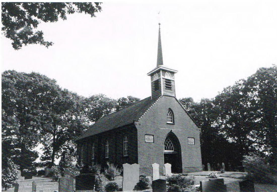
Et karkien van Blesdieke tussen de bomen.

letter s was naor mien daenken wel wat iedel.