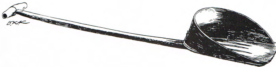
Ofb. 5 De jutte.

As d'r zoe'n bak of drie, vier baggeld weren mos de minger allierend uutjutten . De spitter mos de veenspecie die achter de bak warkt was mit et oolde peerd achteruuttrekken, zoveer as et paand laank was. Et paand was zo groot as de lengte en