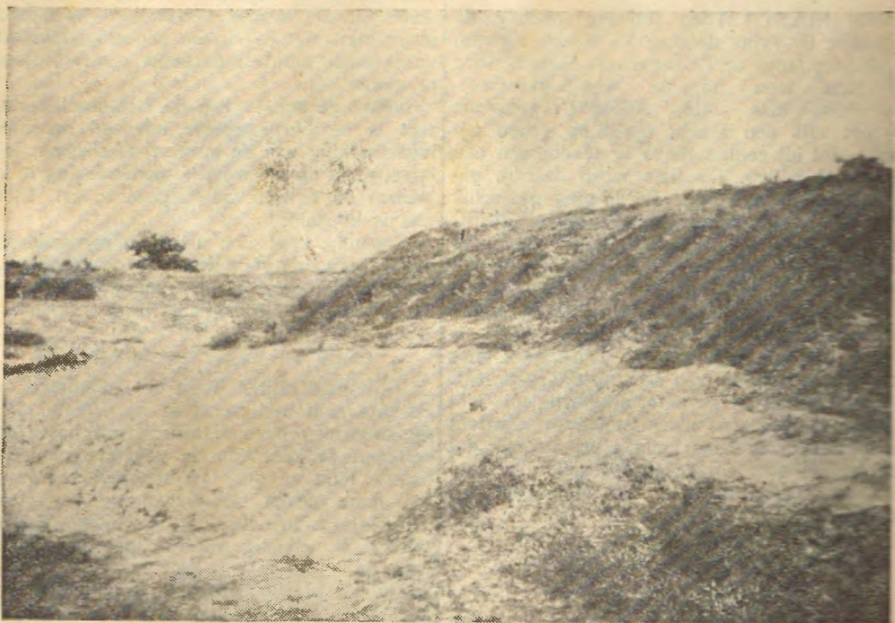
De vindplaats in het Holtingerzand.

We kwamen een beetje onverwacht, maar niettemin was de heer Voerman gaarne bereid ons iets te vertellen van het resultaat van zijn onderzoekingen. Het werd meer dan een kort onderhoud, het werd een buitengewoon