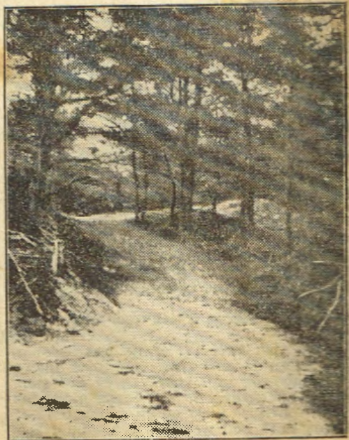
In de bosschen van Appelscha.

werd begin vorige eeuw doorgetrokken tot Appelscha. De eigenlijke ontginning begon hier in 1827. Toen werd de bevolking steeds groter: de veenkolonie Nieuw Appelscha ontstond. De Opsterlandsche Compagnonsvaart en de Witte wijk waren tot 1894 op de Friesch-Drentsche grens gescheiden door den „beruchten dam van Appelscha”, daar Friesland het water van Drenthe niet durfde ontvangen. Eerst in genoemd jaar werd — na een eeuw van onderhandelen — de dam opgeruimd en door een sluis vervangen.