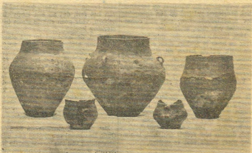
Wat bij Oosterwolde o.m. opgegraven werd. Stille getuigen van een eeuwenoude beschaving.

Waar de nederzettingen over het algemeen in dien tijd niet groot waren, mag men wel aannemen, dat het grafveld zeer vele jaren in gebruik was. Mocht het gelukken deze nederzetting zelf in het omringende maagdelijke veld op te sporen, d.w.z. de grondsporen ervan, dan zou men aan de hand van het te vinden aantal hofsteden hieromtrent eenige berekening kunnen maken.