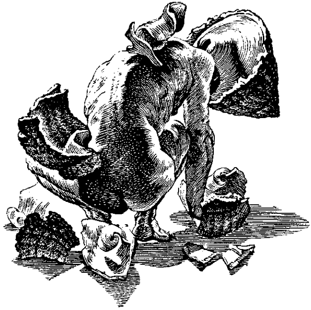
Sweet home II, 1990