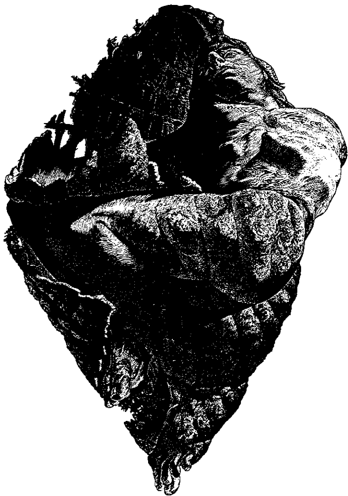
Sweet home, 1990