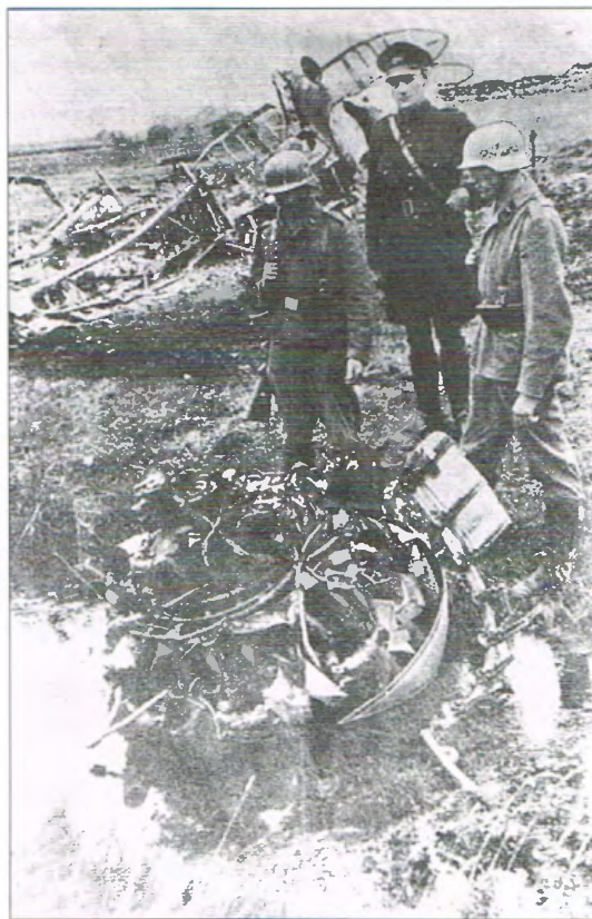
Een dag of wat laeter, op 2 juli 1940, kwam d'r weer een Blenheim naor beneden in oons laand. De P 6895 kwam telane bij Veenhuzen (gem. Heerhugowaard) in Noord-Hollaand.

se jaoren op et plak waar de brokken van et vliegtuug legen hadden in de grond een onderzoek instelden, deur oons doe ofscheuten Ingelse petroonhulzen vunnen binnen. Et het disse jongkerels niet helpen mocht en ze bin niet weer op Wattisham weeromme kommen en wij hadden in oonze omgeving et eerste lochtgevecht mitmaekt. Wij zollen et laeter nog verscheiden keer mitmaeken. De stoffelike overschotten van disse drie jonge mannen was zo verschrikkelijk weinig meer over, dat ze bin in iene kiste begreven, mar d'r bin wel drie grafstienen bruukt, en omdat die uiteindelijk op ien graf staon, staon ze stief tegen mekeer an.