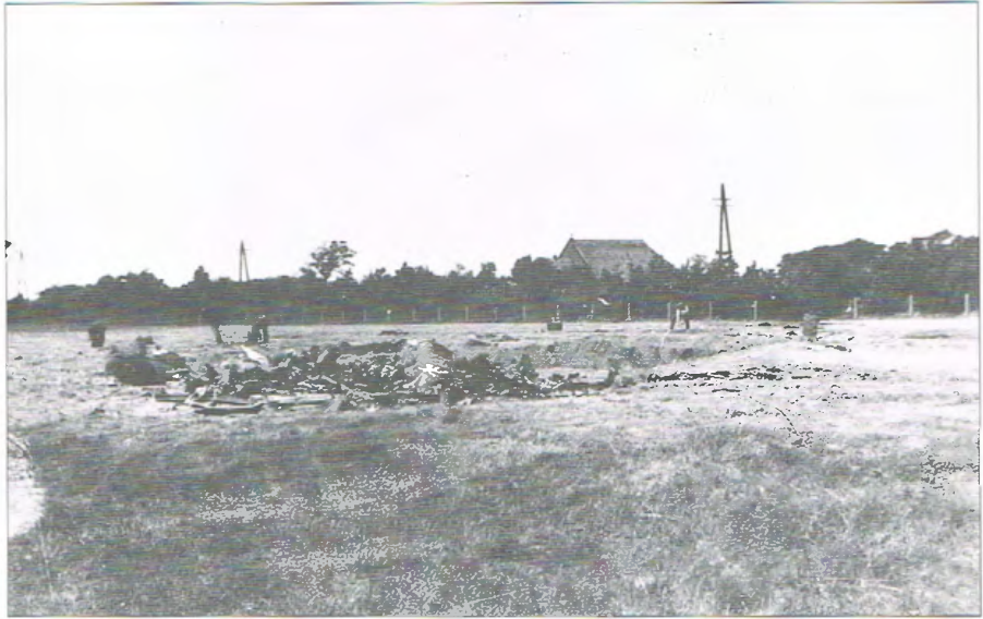
Dit bin de restaanten van de Bristol 'Blenheim' MK 4, (Bello) die op die zundagmiddag 23 juni 1940 daele kwam bij Willemsoord.