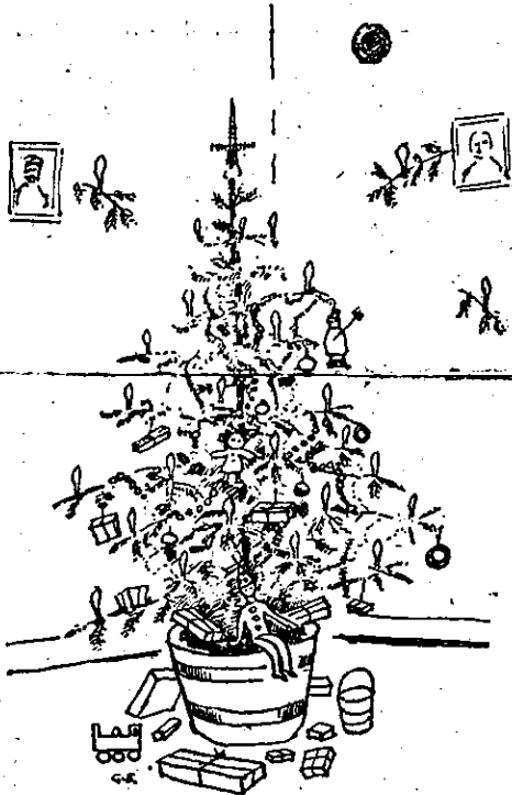
..... en de kleurn gavn een skitternd effekt