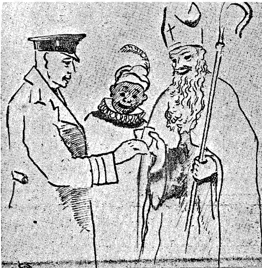
De Sint stak twee baankbiljetten in sien maantel.....