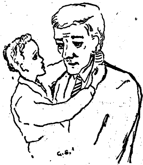
„Pappie waarom is het nou vandaag Kerstmis.....?”