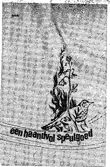
● Dit is de omslag van et boek "Een Haandvol Speulgoed".