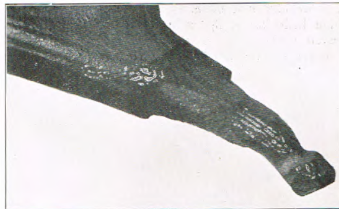
Fig. II. De rendiergeweistang van Steenwijk. Het gebeeldhouwde einde. (Op \pm \frac{1}{2} der ware grootte.)

Zoo werd in de grot van La Madeleine gevonden de poot van een eenhoevig dier, gesneden uit rendierhoorn; verder de afbeelding (gravure) van den achterpoot van een bison. (Zie Capitan en Peyrony, La Madeleine). In Hoernes-Menghin, Urgeschichte der bildenden Kunst in Europa, worden afgebeeld (naar abbé Breuil) een tweetal pooten van hoefdieren. Prof. Kleiweg de Zwaan in zijn „Palaeolithische kunst” vermeldt „een stuk been, gevonden te Mas d'Azil, waarop men in hoogrelief den poot van een paard gemodelleerd ziet”.